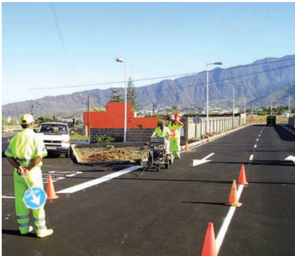
La nueva variante de La Laguna enlaza con la carretera de acceso a Puerto Naos.